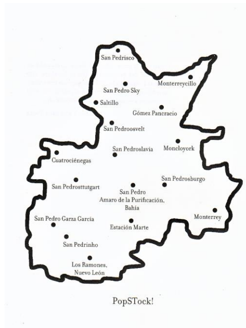
Carte de PopSTock, La Biblia vaquera , p. 12

Carlos Velázquez est un écrivain qui partage les poétiques frontalière et identitaire de Crosthwaite et qui l'accompagne souvent sur les listes d'écrivains dits du Nord confectionnées par les géographes littéraires mexicains. Il dresse une carte possible de ce monde de la culture populaire post-mondialisée, un stock, un réservoir de thèmes et d'éléments culturels manipulables, remplaçables et combinables entre eux même s'ils proviennent de rationalités étrangères : PopSTock. Dans cette carte de PopSTock, les différentes villes à l'honneur de Pedro, avec les particularités typiques des toponymes mexicains, se déclinent contre toute logique mononationale ou monolingue ; de même, La Biblia vaquera est le (sur)nom du personnage principal du livre éponyme, dont les avatars s'appellent aussi The Cowboy Bible . En fin de compte, cela n'a rien d'étonnant dans un livre qui porte comme sous-titre « Le triomphe du corrido [la chanson mexicaine par excellence] sur la logique ».