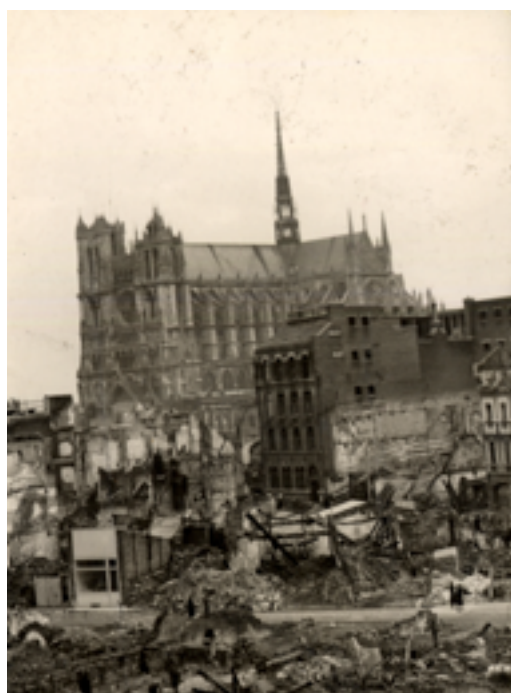
Le quartier de la cathédrale après les bombardements de mai 1940 15