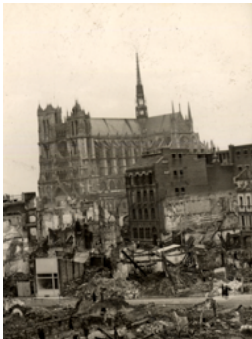
Le quartier de la cathédrale après les bombardements de mai 1940 15