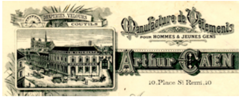
Papier à en-tête de la manufacture fondée par Arthur Caën 8

voyageur de commerce, s'installe à Amiens en 1901, au 55 boulevard du Mail 6 . Entretemps, il a fait en 1899 un beau mariage, en épousant Berthe Dreyfus, d'une famille de diamantaires anversois 7 .