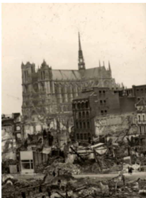
Le quartier de la cathédrale après les bombardements de mai 1940 15