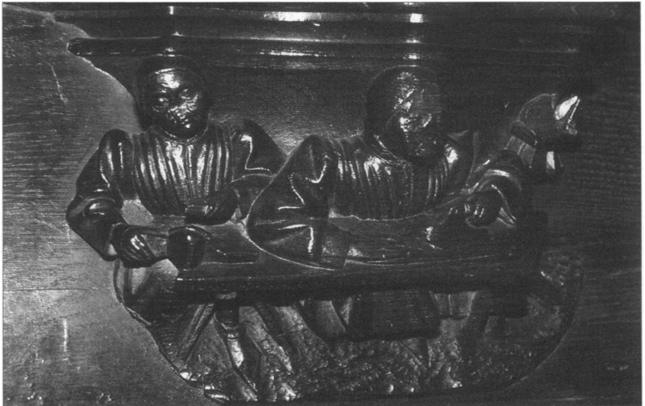
Figure 1 - Rouen, cathédrale, miséricorde, deux cordonniers dans leur atelier, © K. Lemé-Hébuterne

qu'une lame de rasoir. Un cordonnier avisé n'aurait jamais fait cela. Celui de droite tient également un morceau de cuir, qui recouvre un objet plus ou moins arrondi. De la main droite, il manie un outil, peu visible, mais son geste indique qu'il peaufine son soulier : c'est l'étape de la finition, du « bichonnage ». Dans le fond de la miséricorde, à gauche, une petite étagère supporte paires de chaussure ou formes.