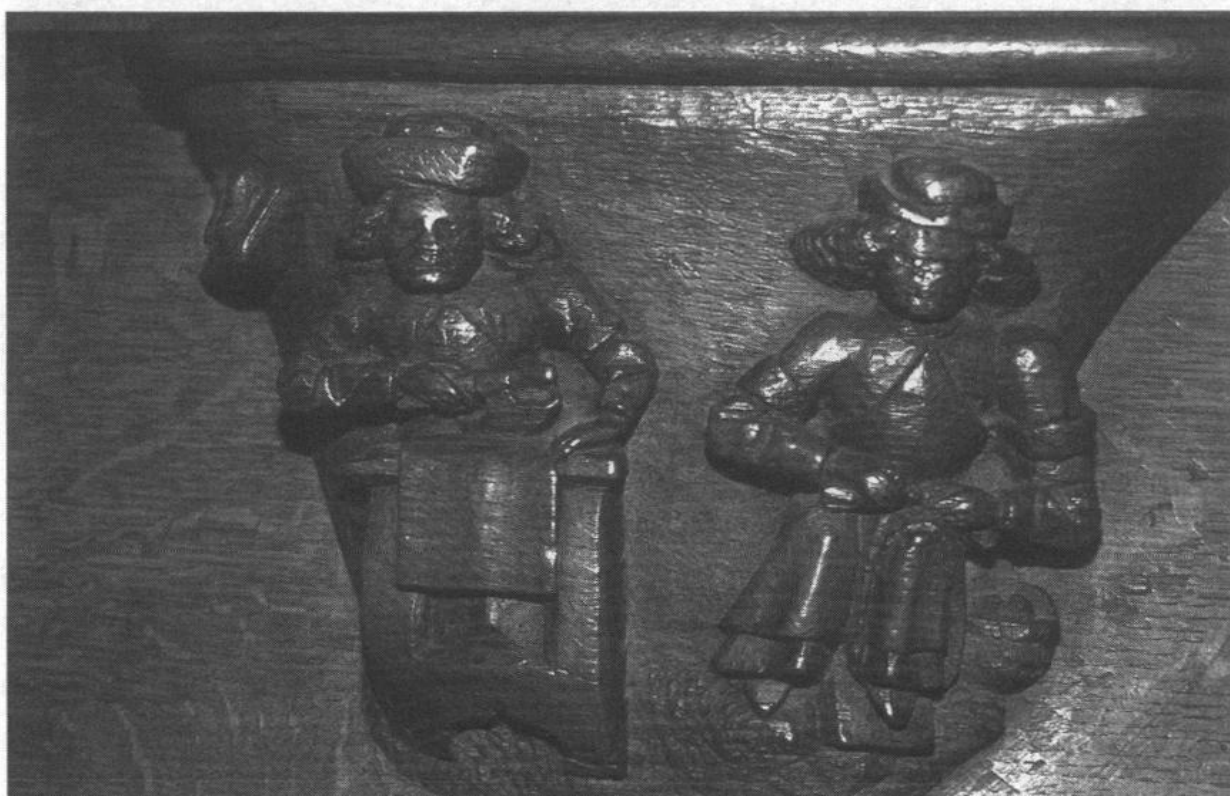
Figure 4 - Mortain, collégiale Saint-Evrault, miséricorde, deux cordonniers, dont l'un utilise le tire-pied

Celui de gauche, de côté, en vêtement mi-long, est assis sur un petit tabouret, devant un billot carré ou rectangulaire sur lequel est posé un morceau de cuir, qui pend sur le côté. Il le découpe à l'aide d'un grand couteau à pied, tenu par un petit manche. Celui de droite nous fait face, penché sur son travail. Son pied gauche est posé sur une espèce de boîte qui le surélève : la miséricorde est malheureusement abîmée à cet endroit, ce qui rend difficile l'interprétation. Son autre pied est au sol. Autour de sa jambe gauche passe une lanière, qui semble partir de la boîte, et fait le tour de la jambe, tenant sur le genou un objet sur lequel l'artisan travaille, cousant ou préparant la couture, en perçant le cuir à l'aide d'une alêne : la lanière sert à tenir sur le genou la chaussure en cours de préparation, afin de laisser la liberté aux deux mains de l'artisan ; elle est ajustable en longueur selon la tension qu'on veut obtenir. Nous avons ici une représentation du tire-pied, outil caractéristique du cordonnier.