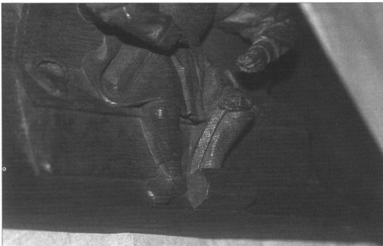
Figure 6 - Paris, Musée national du Moyen Âge-thermes et hôtel de Cluny, misericorde de Saint-Lucien-lès-Beauvais, détail du tire-pied

comme nous le confirment différents croquis destinés à l'apprentissage des techniques de couture (fig. 7), publiés dans des ouvrages du XX e siècle 10 . D'autres ouvrages, plus anciens 11 , mais aussi des figurations de cordonniers au travail dans des œuvres d'art de la fin du Moyen Âge, permettent d'accorder une pleine confiance à ces représentations d'outils (nous reviendrons ultérieurement sur ces comparaisons).