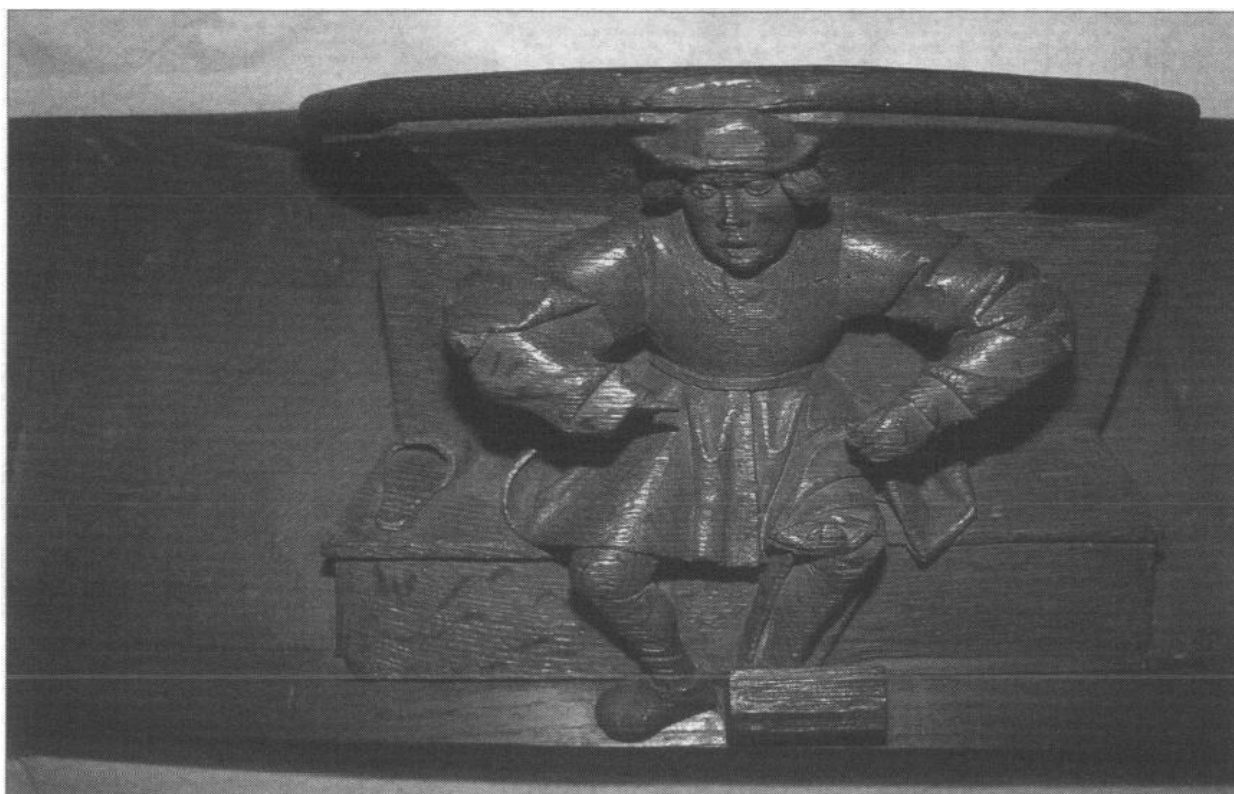
Figure 5 - Paris, musée national du Moyen Âge-thermes et hôtel de Cluny, miséricorde de Saint-Lucien-lès-Beauvais, cordonnier cousant une chaussure à l'aide du tire-pied

cuir souple, qu'il tient de la main gauche et découpe de la main droite à l'aide du couteau à pied, dont le manche est plus long que sur les miséricordes précédentes. La partie métallique qui enserme le manche a été soigneusement représentée. Le personnage de droite est assis : il porte un tablier dont on voit la bavette en pointe sur la poitrine. Ses genoux sont à la même hauteur, et pourtant son pied gauche prend appui sur une boîte rectangulaire posée au sol. Il tient des deux mains un objet long et souple. La courroie du tire-pied, qui fait le tour de sa jambe, est bien visible. À sa gauche, un panier contient des chaussures et en arrière, une étagère suspendue au mur supporte chaussures ou formes.