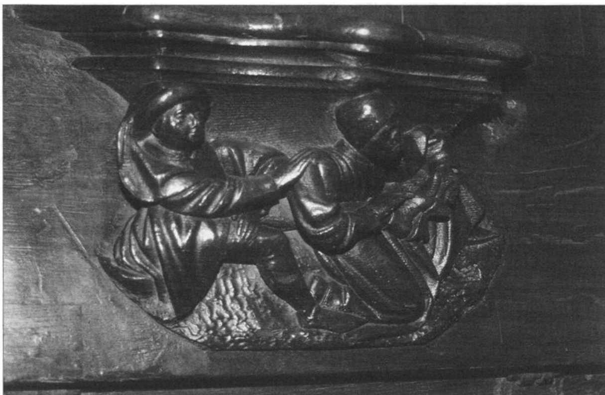
Figure 8 - Rouen, cathédrale, miséricorde, essayage de patins

on retrouve ce genre de patins sur des tableaux du XV e siècle, par exemple posés au sol à côté de l'homme du couple Arnolfini, de Van Eyck 12 .