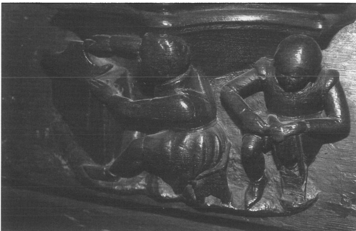
Figure 3 - Rouen, cathédrale , misericorde, deux cordonniers, dont l'un travaille avec le tire-pied