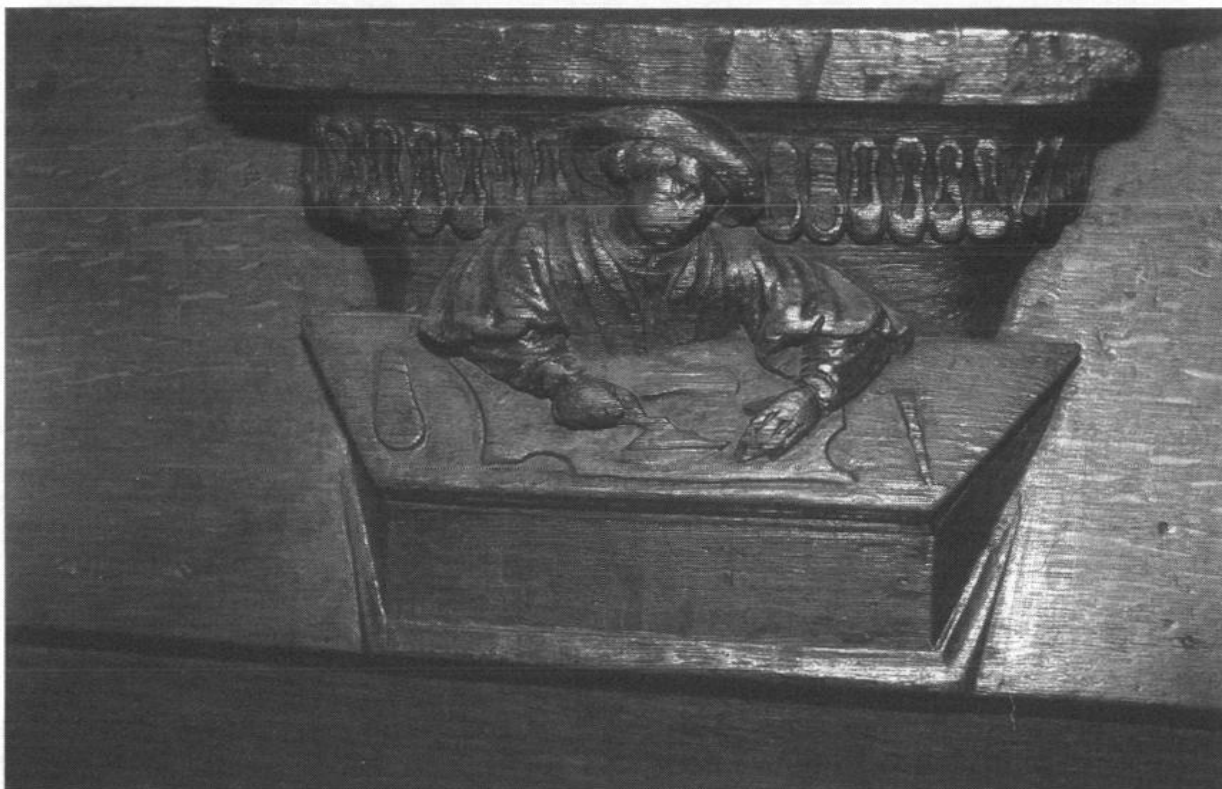
Figure 2 - Paris, église Saint-Gervais-Saint-Protais , misericorde, cordonnier découpant le cuir