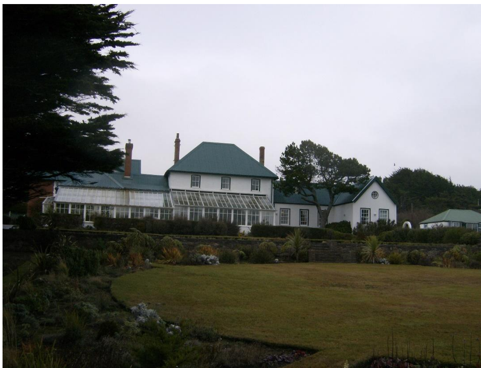
La résidence du gouverneur Menendez à Port Stanley (cliché de l'auteur)