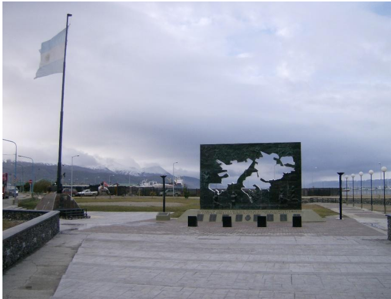
Le monument dédié aux Malouines à Ushuaïa