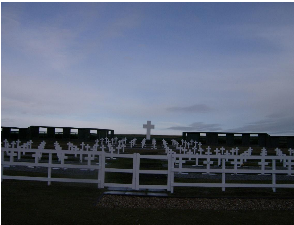
Le cimetière des soldats argentins tués au combat