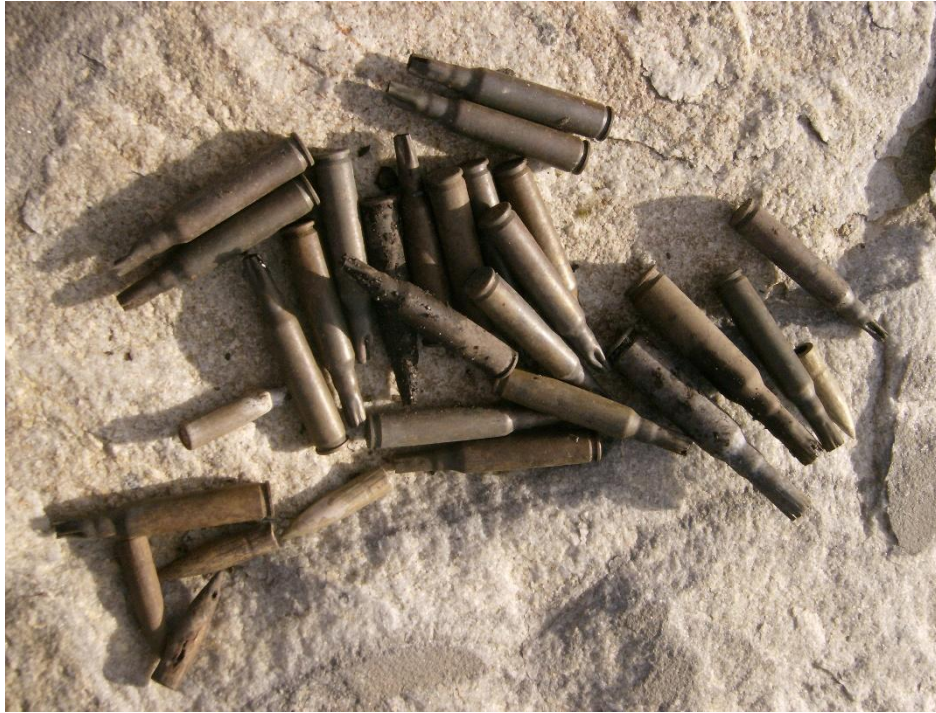
Des douilles restant sur le champ de bataille près de Mont Longdon