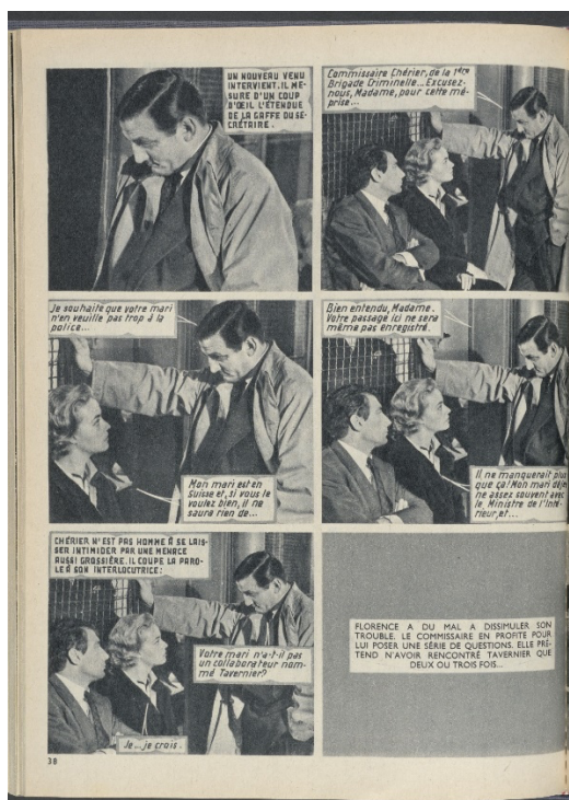
Fig. 5 : « Ascenseur pour l'échafaud », Mon Film , n° 681, octobre 1960 (coll. particulière).

sans trop d'animation, et les séquences qu'ils montent reproduisent moins une suite actionnelle qu'une série de variations sur le portrait ou le buste des comédiens, sans reculer devant la répétition des mêmes photos, comme on le remarque dans cet exemple tiré d' Ascenseur pour l'échafaud (Louis Malle, Gaumont, 1958 ; fig. 5) :