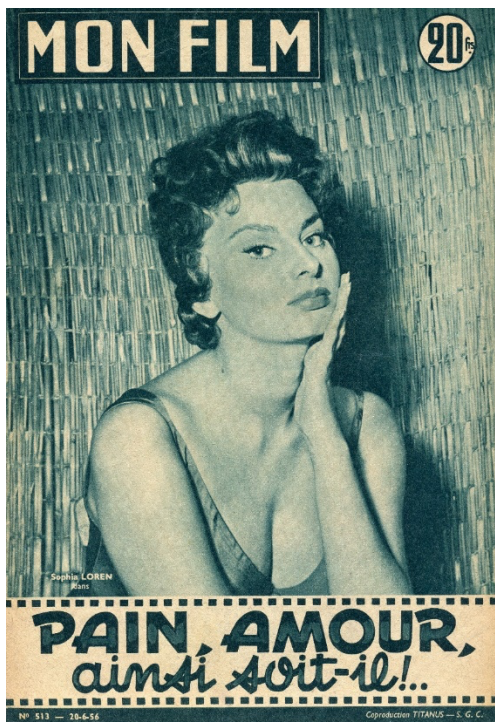
Fig. 1 : « Pain, amour, ainsi soit-il ! ... », Mon Film , n° 513, 20 juin 1956 (coll. particulière).