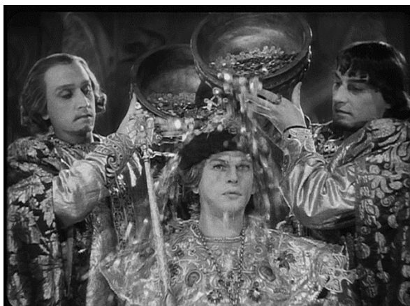
S.M Eisenstein, Ivan le terrible , scène du couronnement, [1945], 1958.

[...] c'est une certaine compacité du fard des courtisans, ici épais, appuyé, là lisse, distingué ; c'est le nez « bête » de l'un, c'est le fin dessin des sourcils de l'autre, sa blondeur fade, son teint blanc et passé, la platitude apprêtée de sa coiffure, qui sent le postiche, le raccord au fond de teint plâtreux, à la poudre de riz 1 .