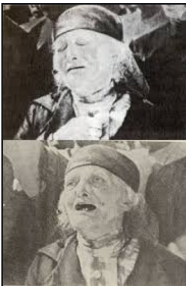
S.M. Eisenstein, Le Cuirassé Potemkine , funérailles de Vakoulintchouk, 1925.

J'ai alors compris que la sorte de scandale, de supplément ou de dérive imposée à cette représentation de la douleur, provenait très précisément d'un rapport ténu : celui de la coiffe basse, des yeux fermés et de la bouche convexe ; ou plutôt [...] d'un rapport entre la « basseur » de la ligne coiffante, anormalement tirée jusqu'au sourcils comme dans ces déguisements où on veut se donner un air loustic et niais, la montée circonflexe des sourcils passés, éteints, vieux, la courbe excessive des paupières baissées mais rapprochées comme si elles louchaient, et la barre de la bouche entrouverte, répondant à la barre de la coiffe et à celle des sourcils, dans le style métaphorique « comme un poisson à sec 1 ».