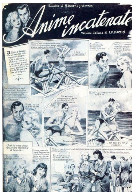
Fig. 3 : « Anime incatenate », Grand Hôtel , 1 ère année, n° 1, 1946 (coll. Particulière).

(actualités, potins, photos), la bande dessinée . Son succès sera foudroyant, mais étonnamment court, puisqu'un an plus tard arrive déjà le roman-photo qui va rapidement se substituer à lui.