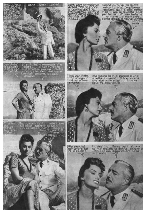
Fig. 2 : « Pain, amour et... », Ciné Sélection , 5 e année, n° 74, septembre 1962 (coll. particulière).

Lorsqu'on analyse ces deux phénomènes – à savoir la coexistence des deux formules au sein d'une seule revue, la métamorphose des revues de film raconté en revues de ciné-roman-