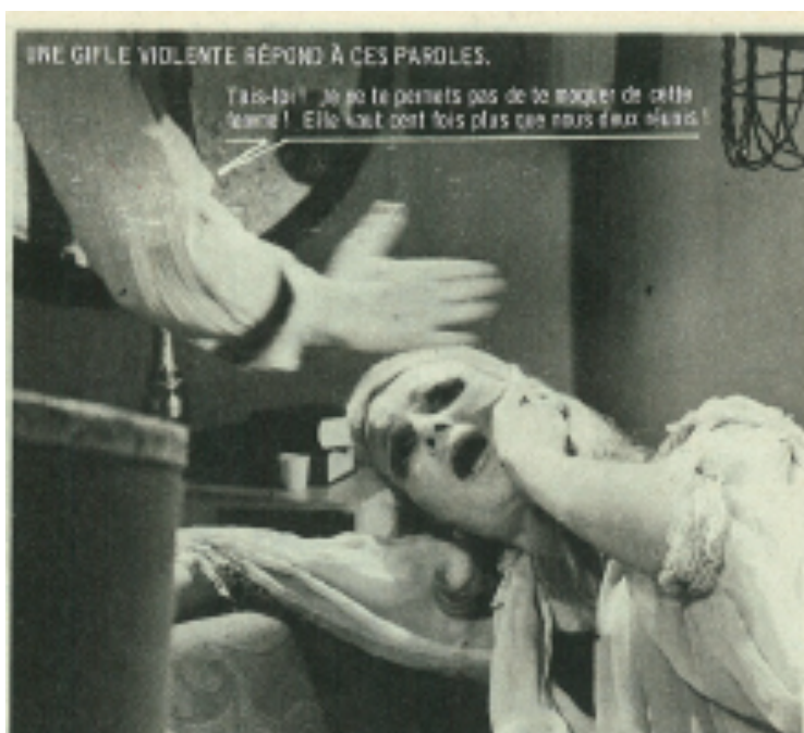
Madame Bovary, Nous Deux , n° 1340, 8 mars 1973.

caricaturales. Comme forme dérisoire, le roman-photo prête aussi à rire tant son exagération est sans finesse. Les vignettes de Bovary 73 fourmillent de cette approximation risible et sottise, par exemple celle-ci où Emma se fait gifler, offrant un visage de la douleur fort comparable, jeunesse mise à part, à celui de la vieille dame.