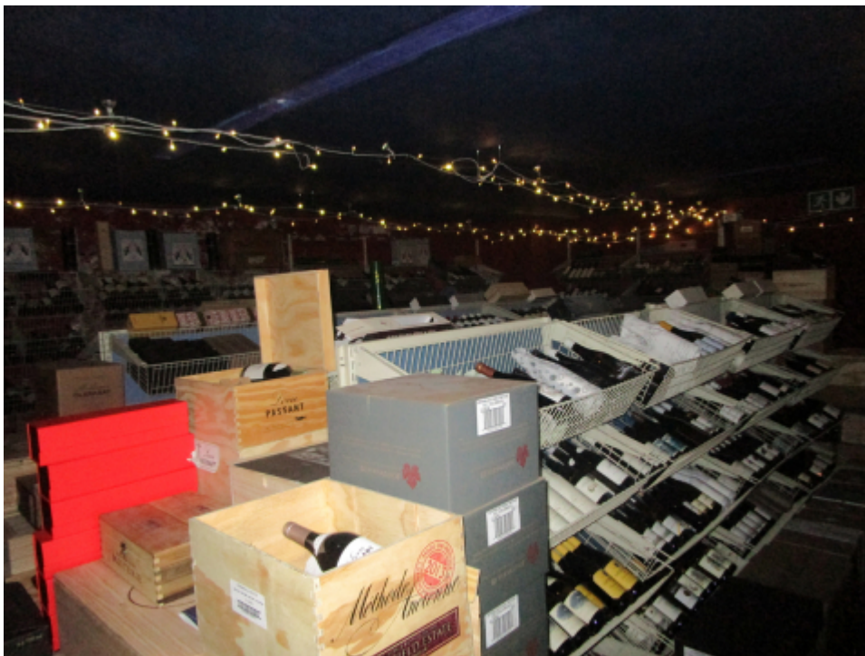
Fig. 9 : l'intérieur de la boutique avec son assortiment de vins (1)