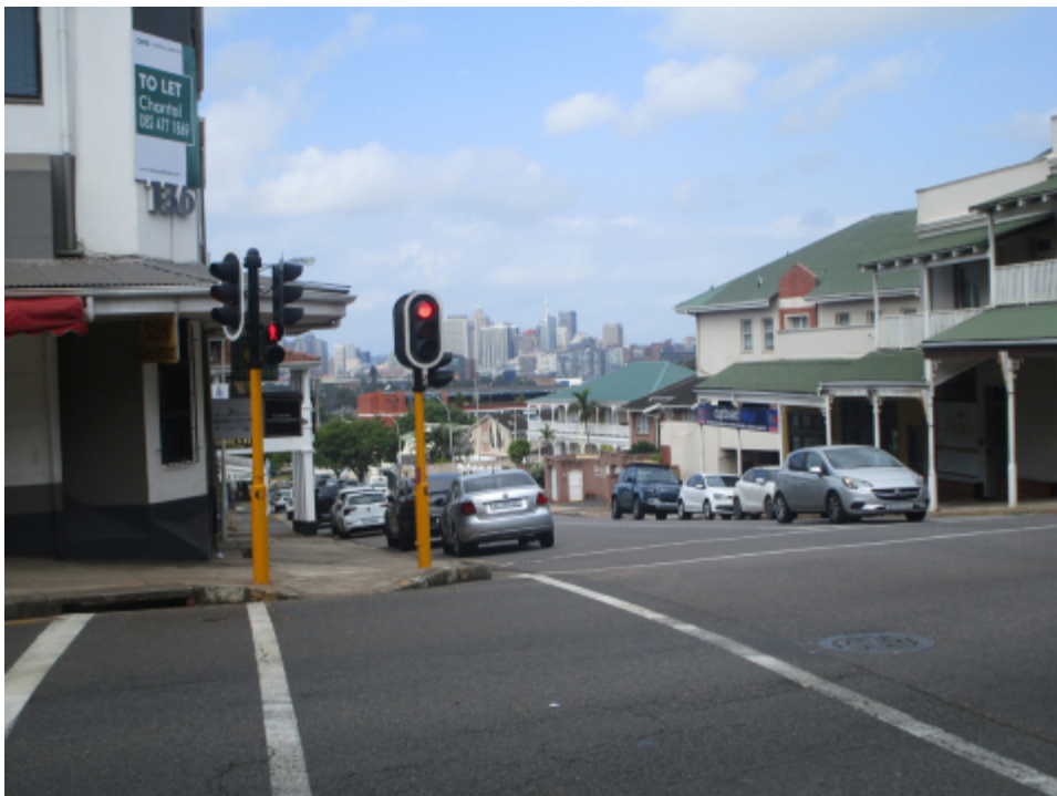
Fig. 5 : la rue Gladys Mazibuko

Avec un exemple de l'architecture à vérandas, typique de la ville, et les immeubles plus modernes du centre-ville en arrière-plan.