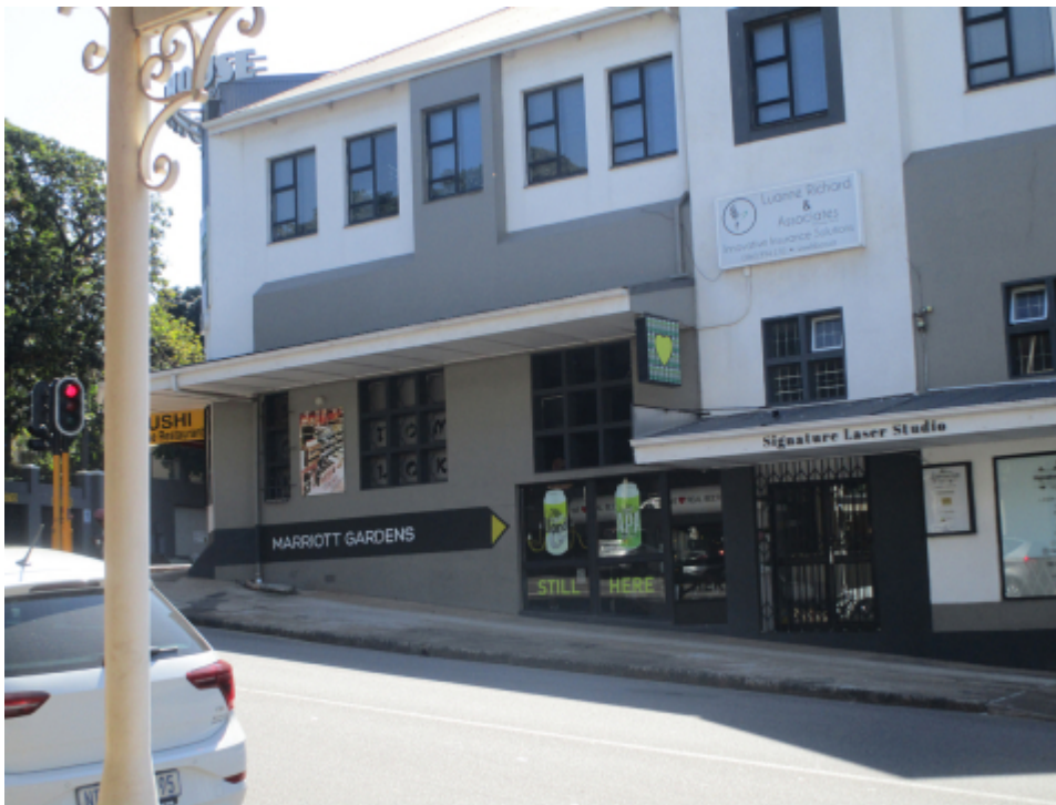
Fig. 3 : la boutique d'Herve ( Marriott Gardens )

On voit la vitrine et l'entrée en contre-bas