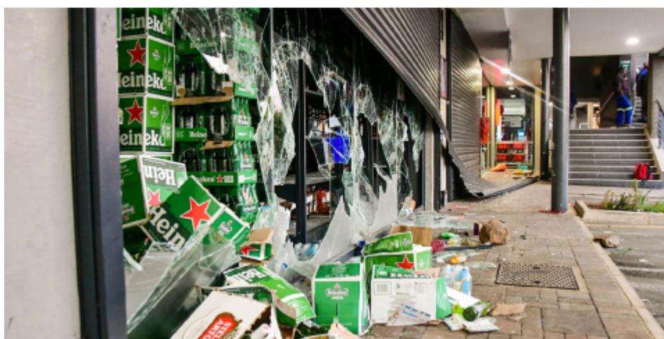
Fig. 11 : un magasin d'alcool de la chaîne Spar (« Spar Tops Liquor ») dans un centre commercial de Pinetown, un quartier de l'ouest de la ville