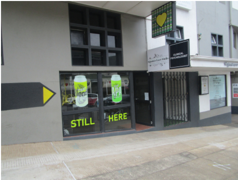
Fig. 14 : Toujours là

La nouvelle enseigne de Marriott Gardens depuis le début de 2023 avec la publicité pour la bière artisanale locale