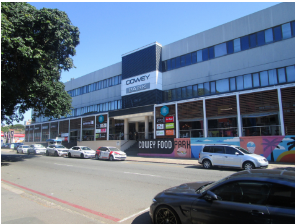
Fig. 7 : sur Problem Mkhize, Cowey Park

Avec ses restaurants et des commerces avec produits à emporter, la plupart halal comme The Oriental .