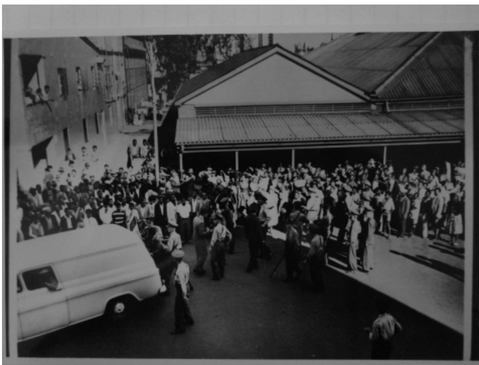
Fig. 13 : ces femmes sont délogées par la police et embarquées au poste